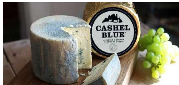
Degustación de Cashel Blue, el primer queso azul irlandés.