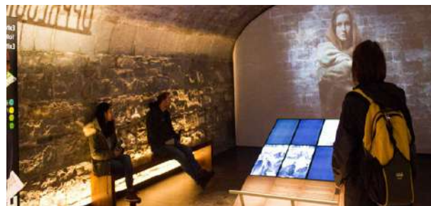
Visita al EPIC - Museo de la Emigración Irlandesa