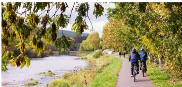
Recorrido en bici por Suir Blueway