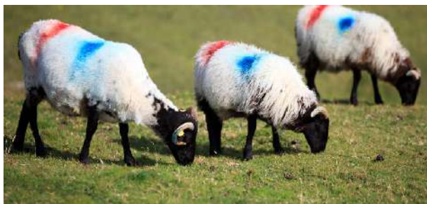
Visita a la granja de ovejas Gleen Keen en la "Wild Atlantic Way"