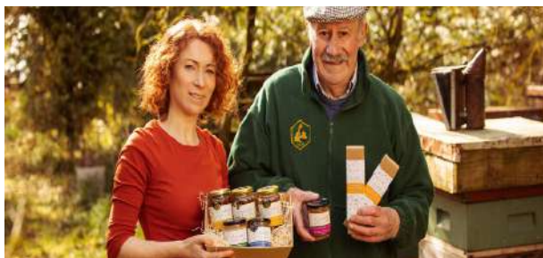
Visita a la Granja de Miel de Galtee y degustación de miel y aguamiel