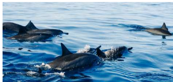
Paseo en barco con Dolphin and Nature y observación de delfines