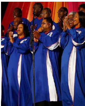
Compartir con la comunidad afroamericana cantos Góspel en Harlem