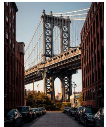
Visitar los barrios con más carácter de Nueva York con un guía experto y conocer sus contrastes