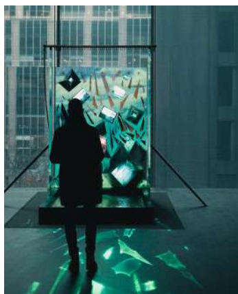
Visita al MOMA con guía oficial