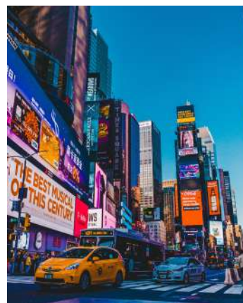
Alojamiento en Times Square