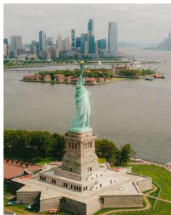
Navegar hasta la Isla de la Libertad y descubrir las mejores vistas de NYC