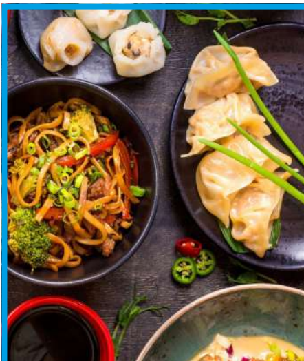
Clase de cocina tradicional china en un restaurante local.