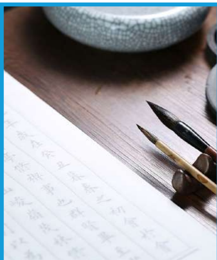
Asistencia a un curso del antiguo arte de caligrafía china.