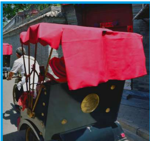
Paseo en triciclo por los Hutong (callejuelas antiguas).