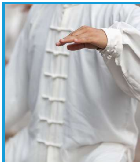
Clase de Tai Chi con un maestro profesional.