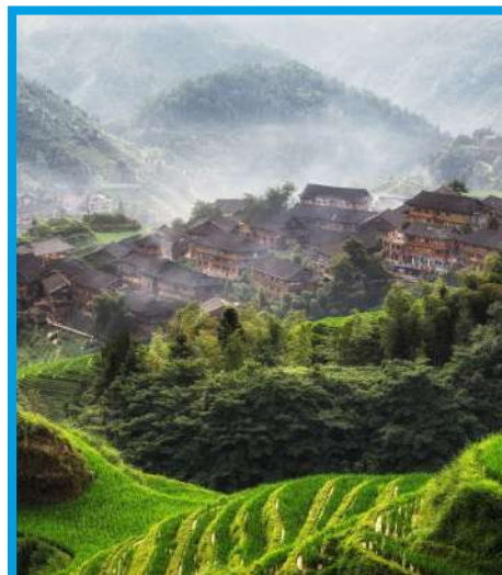
Descubrir las terrazas de arroz de Longji y visita a las aldeas típicas.