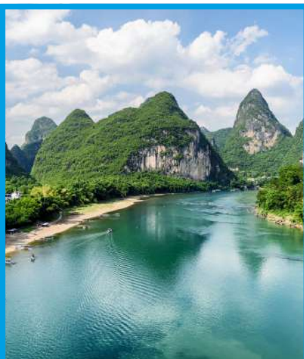
Crucero por el río Lijiang.