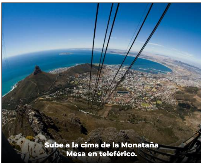
Sube a la cima de la Monaña Mesa en teleférico.