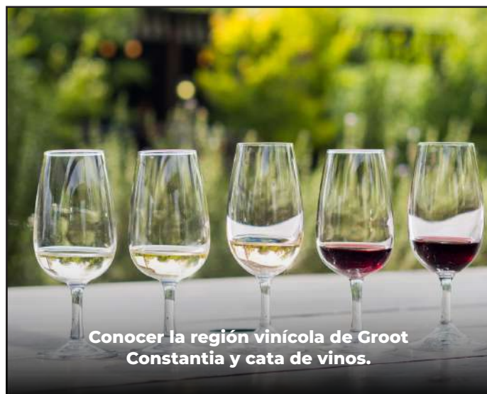
Conocer la región vinícola de Groot Constantia y cata de vinos.