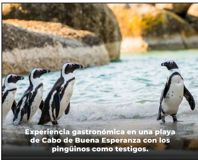
Experiencia gastronómica en una playa de Cabo de Buena Esperanza con los pingüinos como testigos.