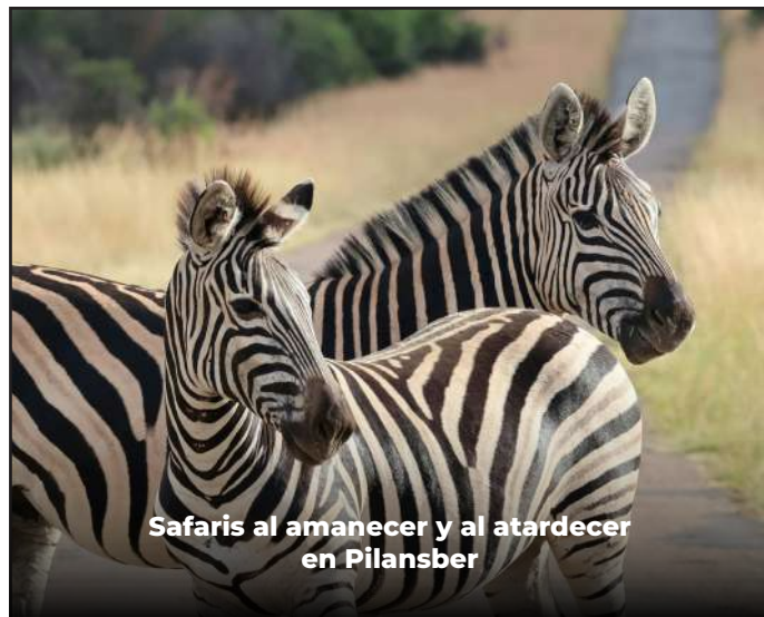
Safaris al amanecer y al atardecer en Pilansber