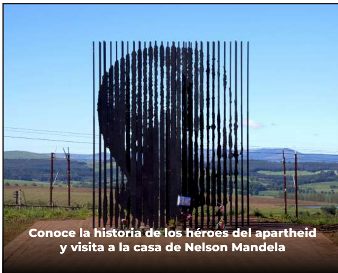
Conoce la historia de los héroes del apartheid y visita a la casa de Nelson Mandela