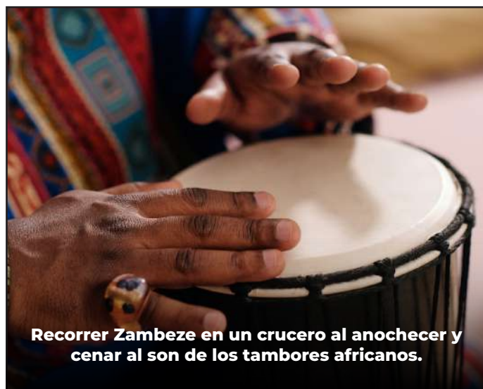
Recorrer Zambeze en un crucero al anochecer y cenar al son de los tambores africanos.